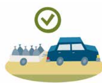
3. Släng inte invasiva växter i komposten, du behöver packa dem väl förslutet.