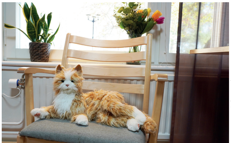
Ett av det särskilda boendet Alvens digitala terapidjur.

För att bli behörig att få ge ut läkemedel i kommunen behöver man klara ett särskilt delegeringsprov. Provet är endast giltigt i ett år och genom detta system kan sjuksköter- skorna alltid ha koll på att de som ger läkemedel har aktuell kompetens inom området.