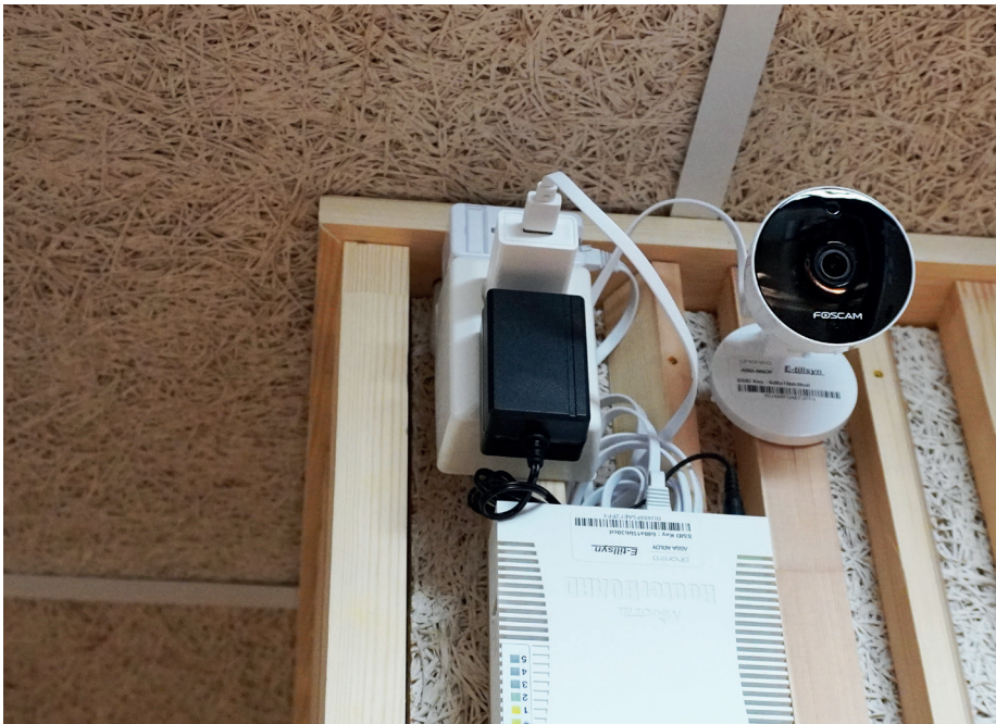
Trygghetskamera i ett av kommunens särskilda boenden. Kameran filmar inte konstant utan aktiveras automatiskt först när ett larm som är kopplat till en av de boende har löst ut.