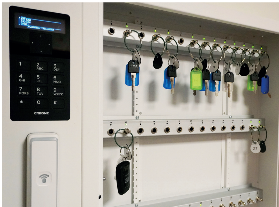
Hemtjänstens digitala nyckelskåp.