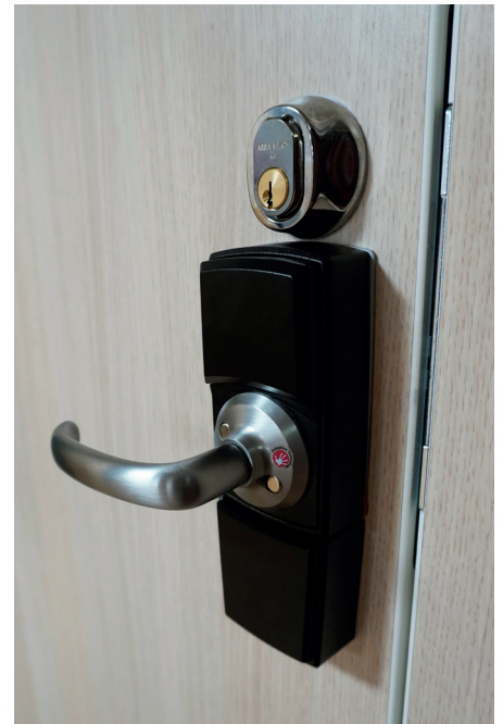
Digitalt lås till en lägenhetsdörr.

telefonen, då kan vi följa upp om det skulle ske en incident kopplat till läkemedelshanteringen.