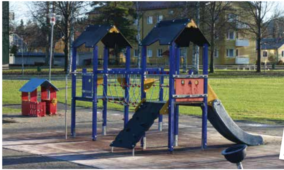
Foto från Myranparkens lekplats som rustades upp 2012.

Tre av de medborgarförslag som har inkommit till kommunen har nu blivit godkända och kommer att prövas eller åtgärdas under 2014.