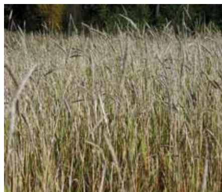
En hektar rörflen räcker för att producera 30-40 MWh energi per år, vilket motsvarar 3-4 kubikmeter olja.

Nästa steg för projektet Rörflen till biogas i Vännäs är att identifiera kunskapsluckor och kompetensutveckla de personer som är med i arbetet kring Klara Gas.