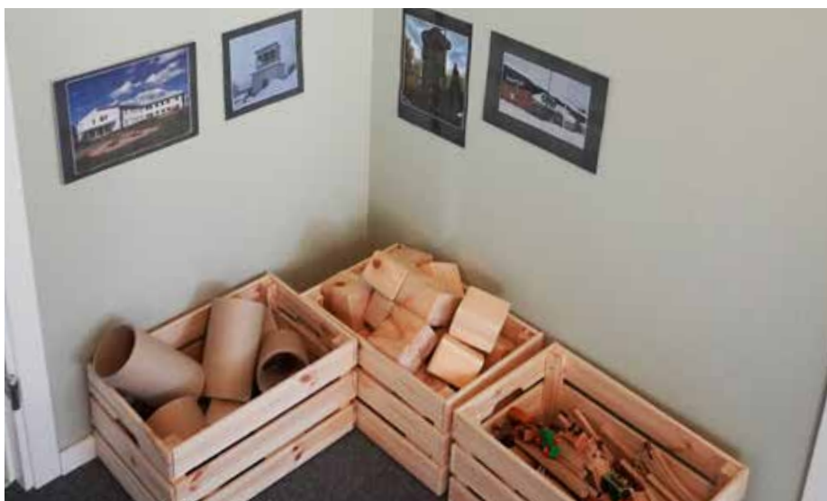
Bygg- och konstruktionshörnan. Här får barnen bygga fritt med olika material och klossar. På väggen hänger bilder på byggnader i Vännäs.