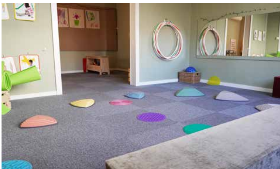
Rörelserummet. I rörelserummet erbjuds alltid musik, dans och balansträning. Här finns tunnlår, trummor och rytm-ägg. Ibland bygger barnen olika banor längs golvet.