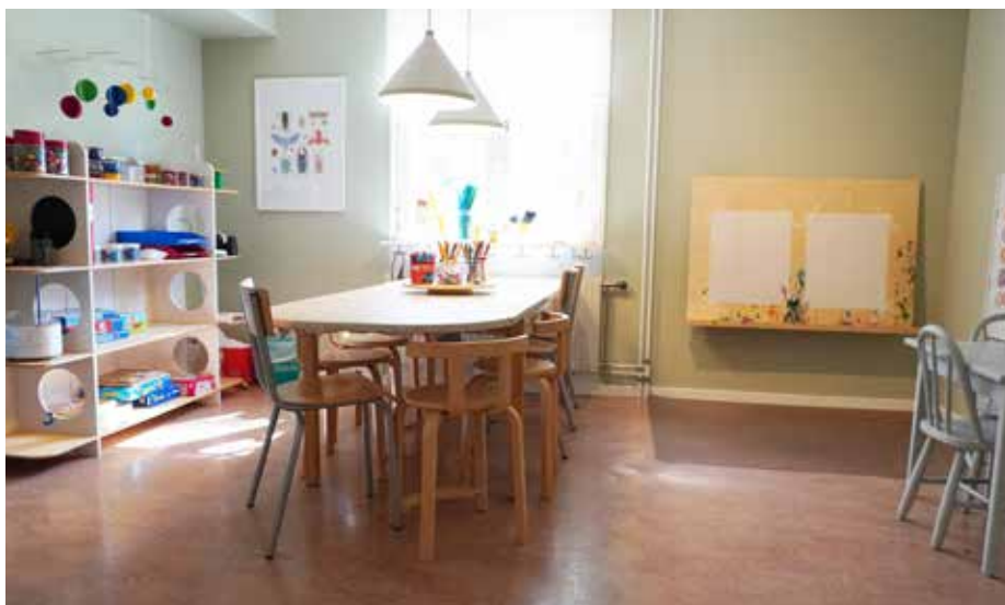
Ateljén. Här sker organiserat skapande med de äldre barnen. De får skapa, måla eller arbeta med lera tillsammans med sina föräldrar.